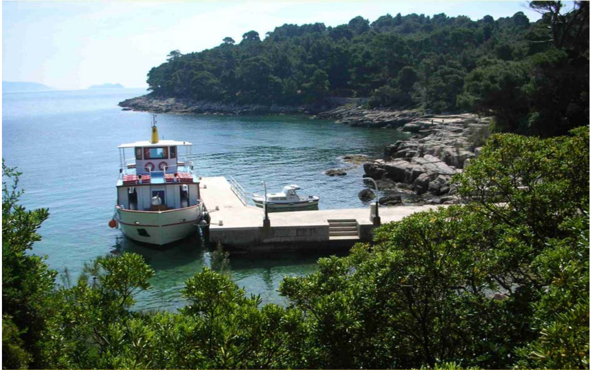
BLICK AUF UNSERE FÄHRE