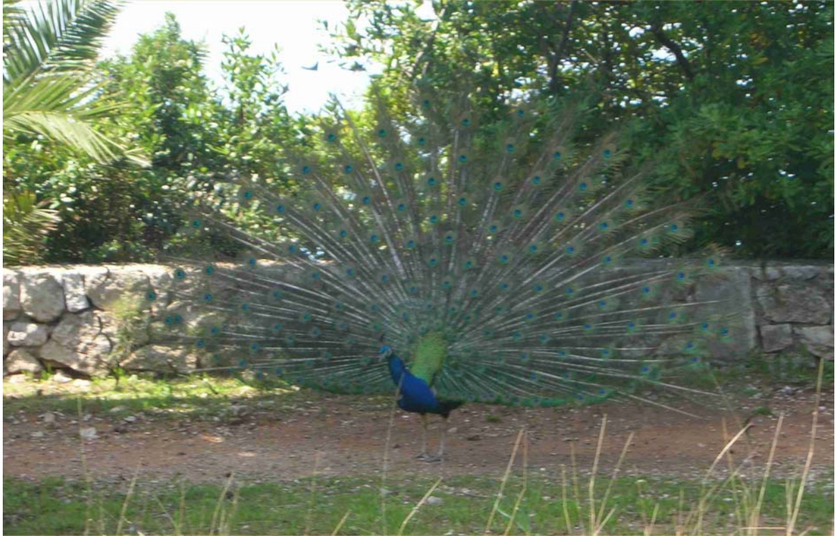
AUCH WILD LEBENDE PFAUE KANN MAN AUF LOKRUM BEWUNDERN