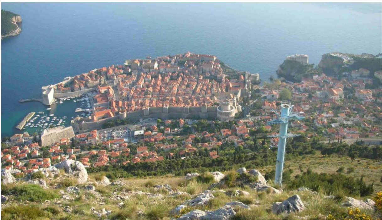
NOCH EINMAL EIN BLICK AUF DIE ALTSTADT VON DUBROVNIK VON DER EHEMALIGEN BERGSTATION DER SEILBAHN AUS