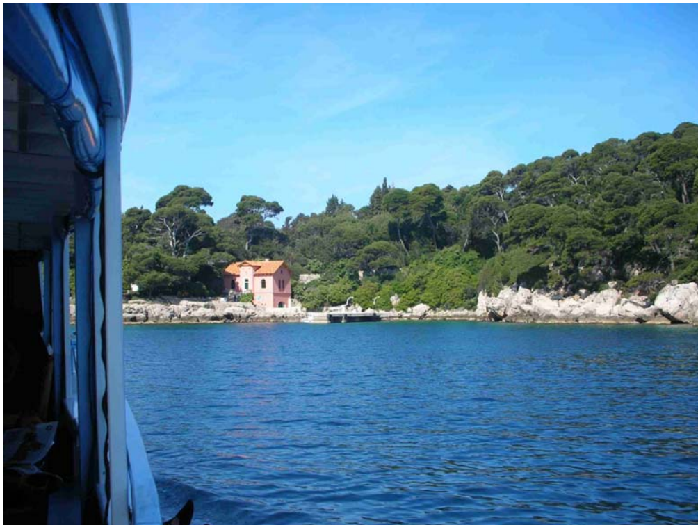
DER ANLAGEPLATZ AUF LOKRUM