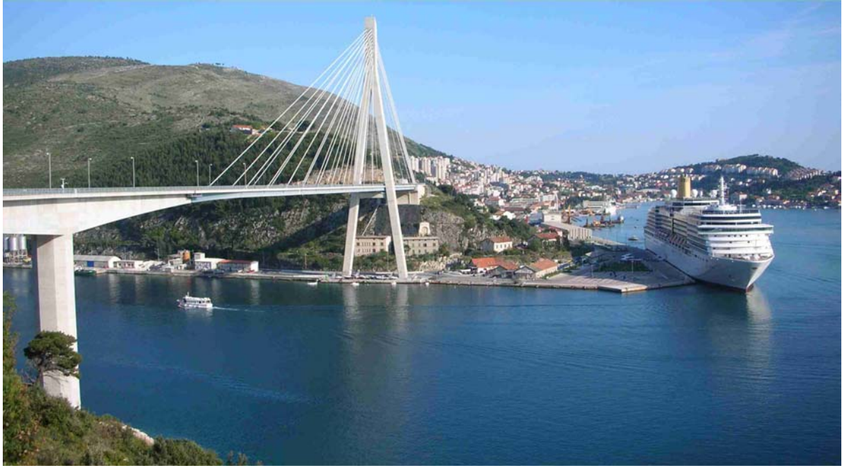
DIE TUJMAN BRÜCKE ALS BEGRÜßUNG