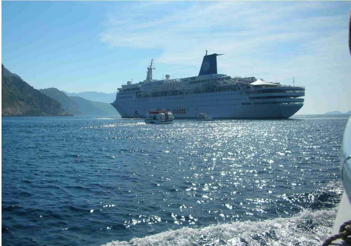
BEI DER ÜBERFAHRT AUF DIE INSEL LOKRUM .....WIEDER EINMAL EIN KREUZFAHRT SCHIFF