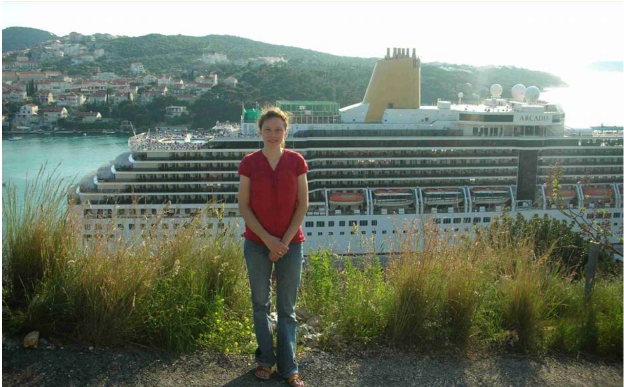
EIN RIESIGES KREUZFAHRTSCHIFF WAR GERADE ZU BESUCH