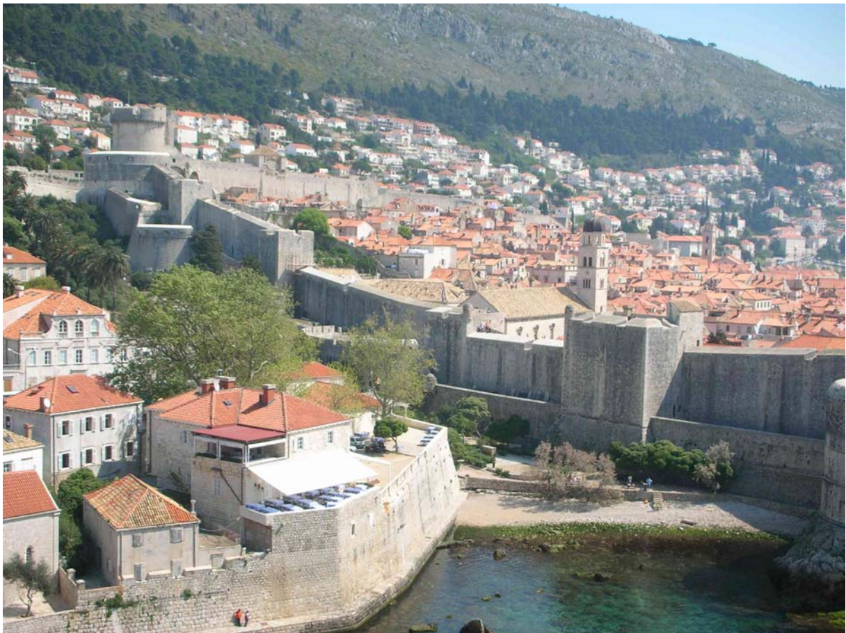
BESONDERS BEEINDRUCKEND SIND DIE RIESIGEN STADTMAUERN