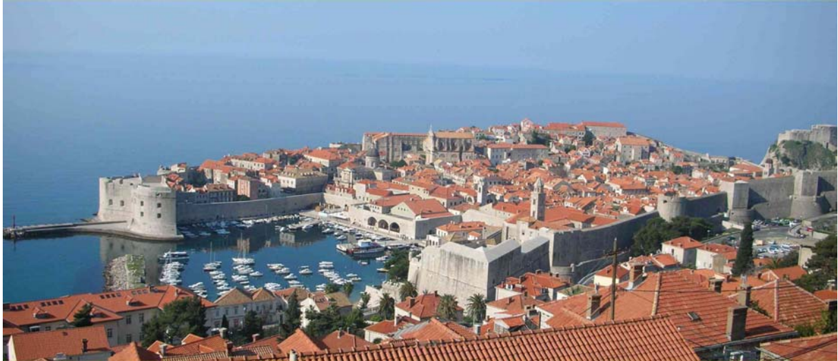
DER BLICK VON UNSEREM BALKON AUF DIE ALTSTADT WELTKULTURERBE DER UNESCO