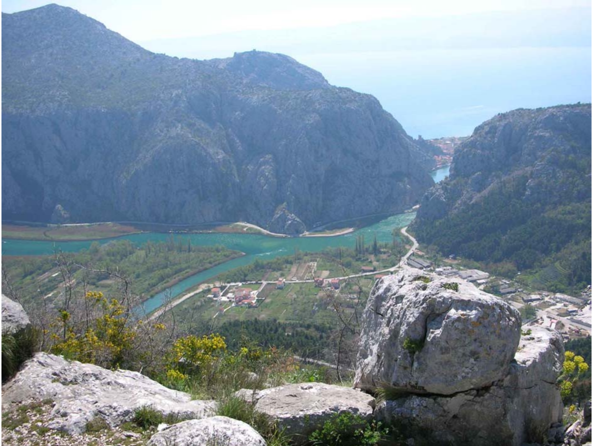
BLICK AUF DIE MÜNDUNG DER CETINA INS OFFENE MEER