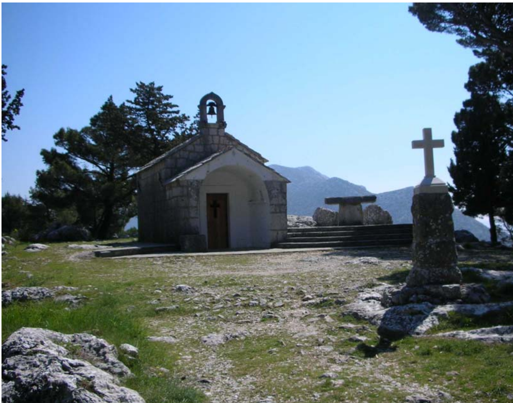
BEI EINER GEMEINSAMEN WANDERUNG IN DER NÄHE VON OMIS