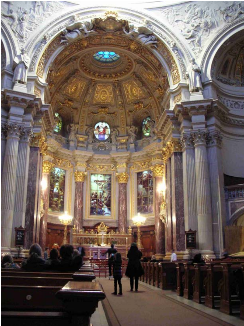
IM JÄNNER HABEN WIR EINIGE TAGE IN BERLIN VERBRACHT – HIER IM BERLINER DOM