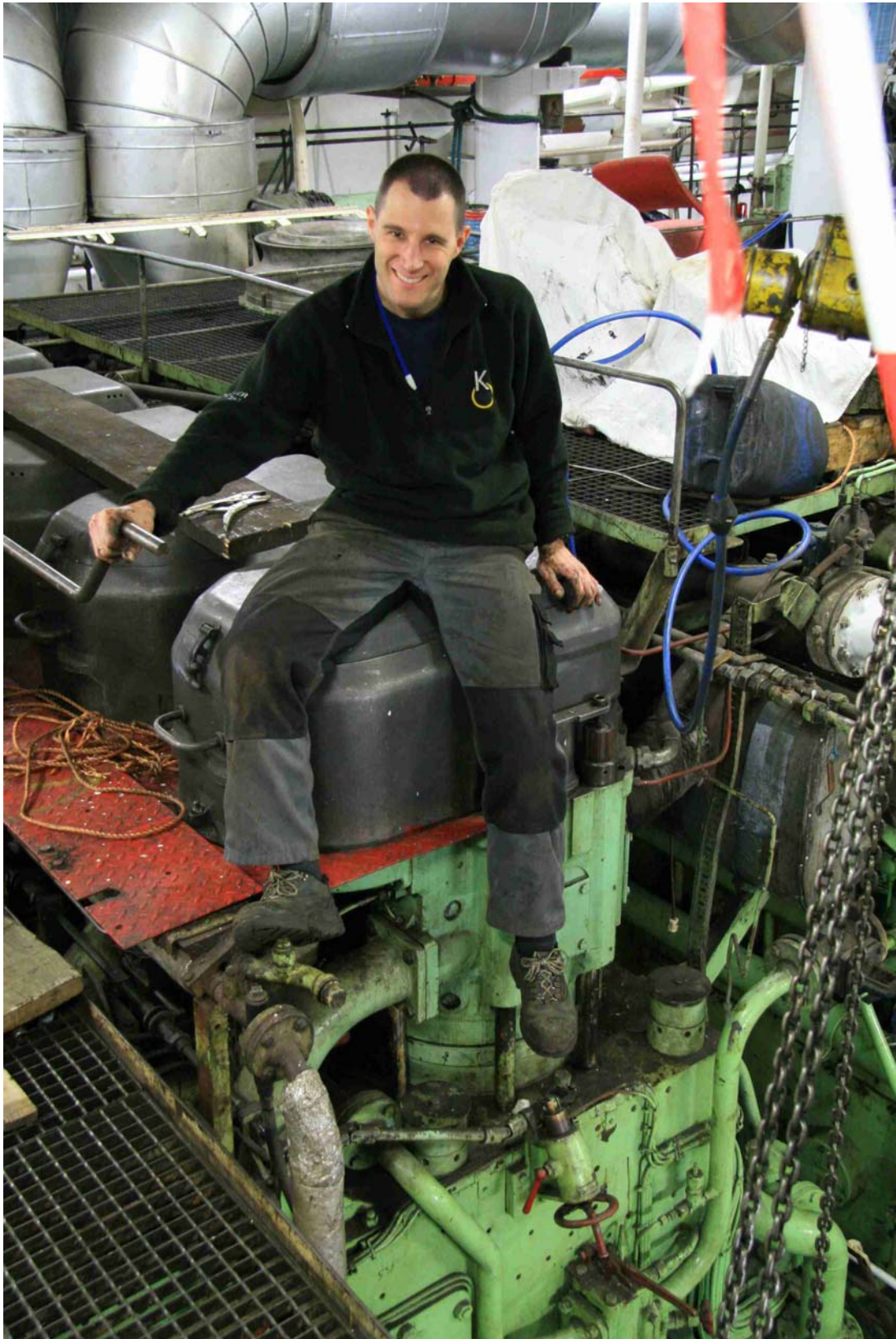
NACH GETANER ARBEIT BEIM AUSRASTEN AUF DER HAUPTMASCHINE 4