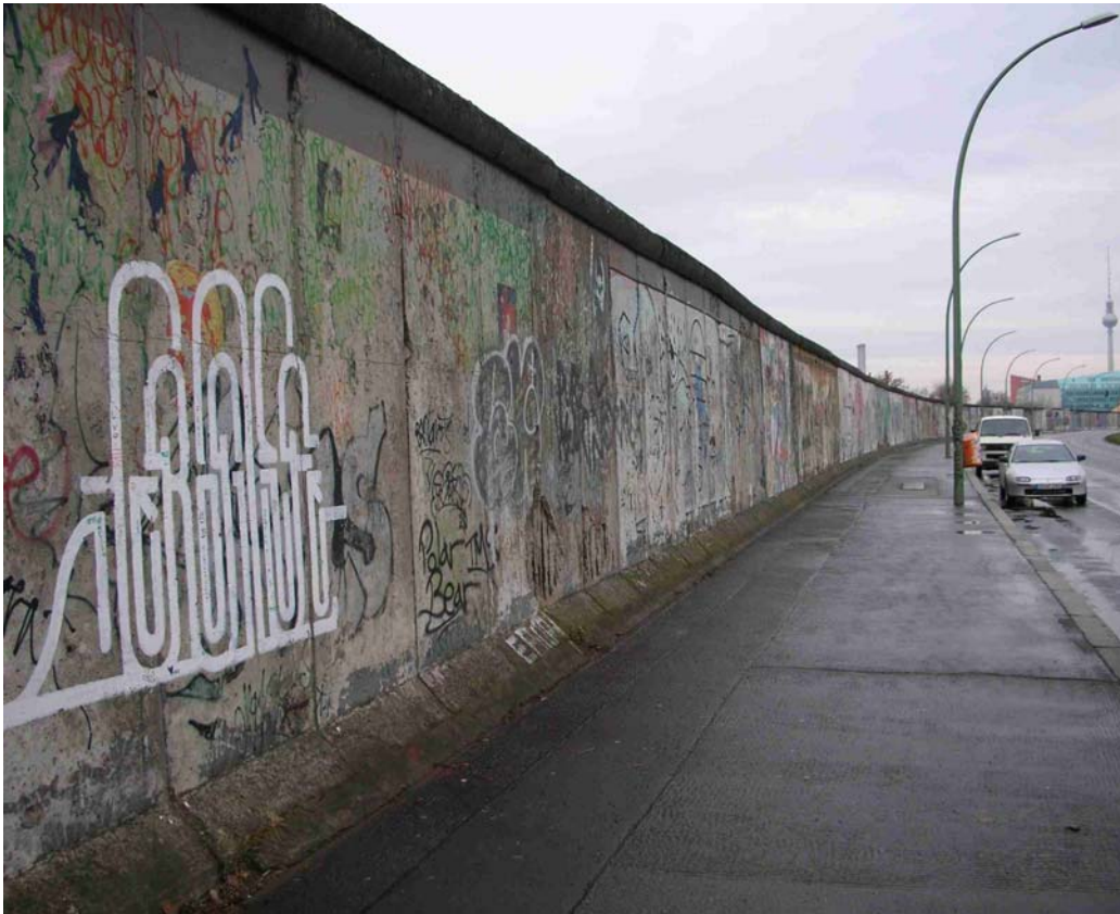
... UND AN DER BERLINER MAUER ...