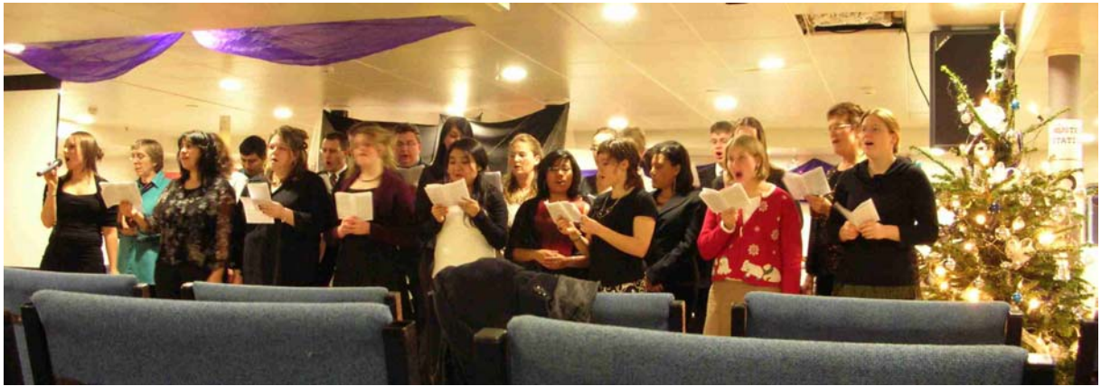
AM WEIHNACHTSABEND DURFTEN WIR AUCH IM CHOR MITSINGEN