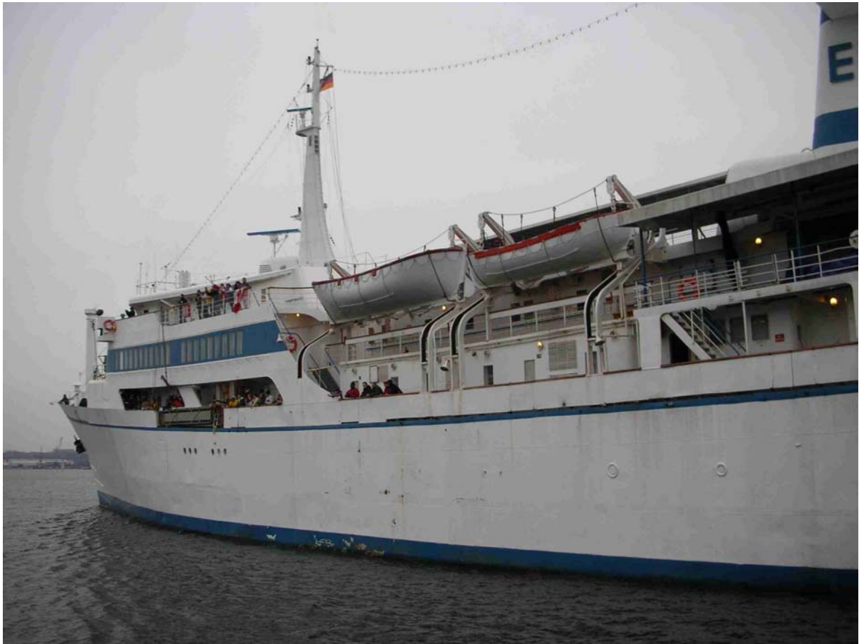
ENDE JÄNNER HAT UNS DANN DIE LOGOS II VERLASSEN – RICHTUNG KARIBIK