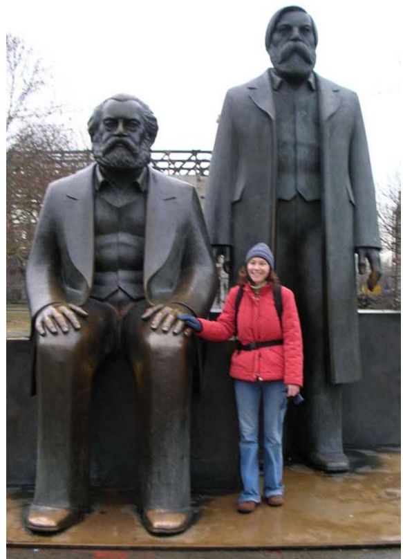
... SOWIE AM MARX-ENGELS DENKMAL