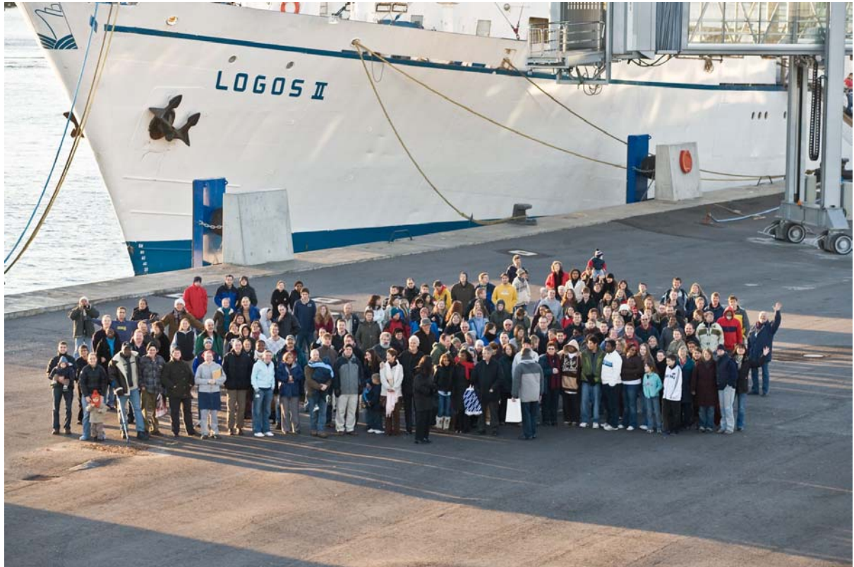
DAS 1. GEMEINSAME FOTO DES ZUKÜNFTIGEN LOGOS HOPE TEAMS