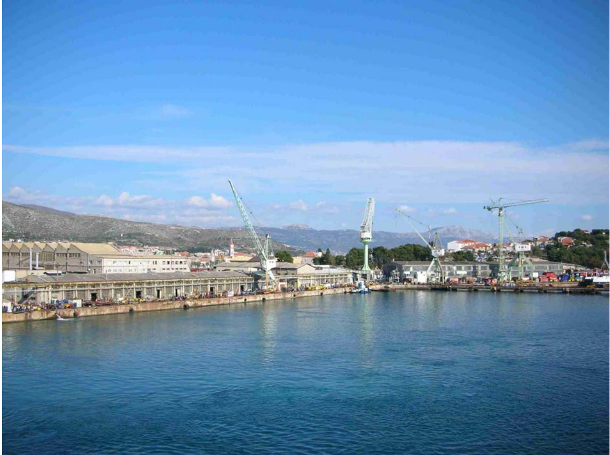
EIN LETZTER BLICK NACH TROGIR – HEIMAT DER LETZTEN 14 MONATE