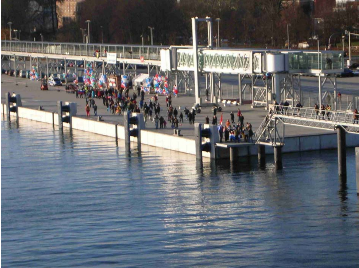
DIE GESAMTE LOGOS 2 BESATZUNG WARTET SCHON AUF UNS