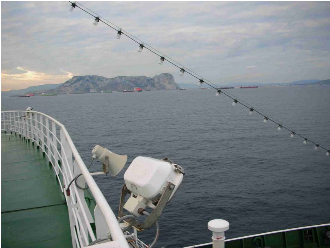
NACH DEM AUFTANKEN IN MALTA GAB'S NOCH EINEN KURZEN STOP BEIM FELSEN VON GIBRALTAR