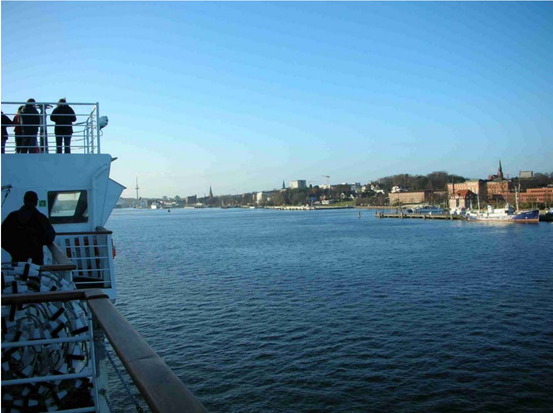
BEIM EINLAUFEN IN KIEL, HAUPTSTADT VOM BUNDESLAND SCHLESWIG-HOLSTEIN