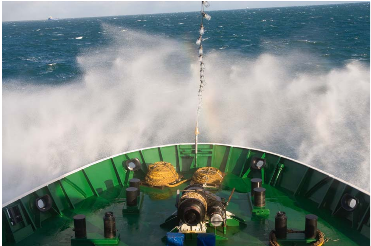
GLEICH IN DER ZWEITEN NACHT KAM EIN STURM AUF DER VIELE ANS BETT FESSELTE