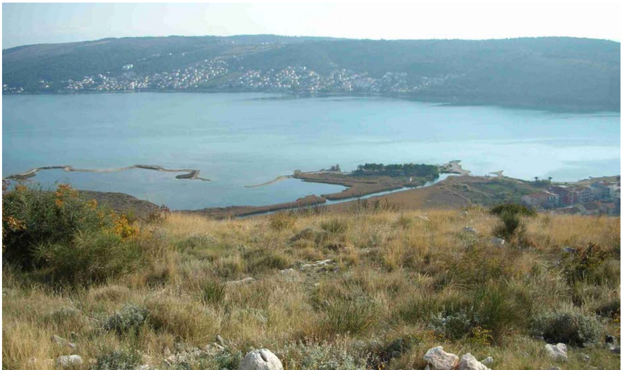
DER BLICK VON DER KAPELLE HINTER DEM HAUS AUF „MOSQUITO BEACH“ - UNSEREN BADESTRAND