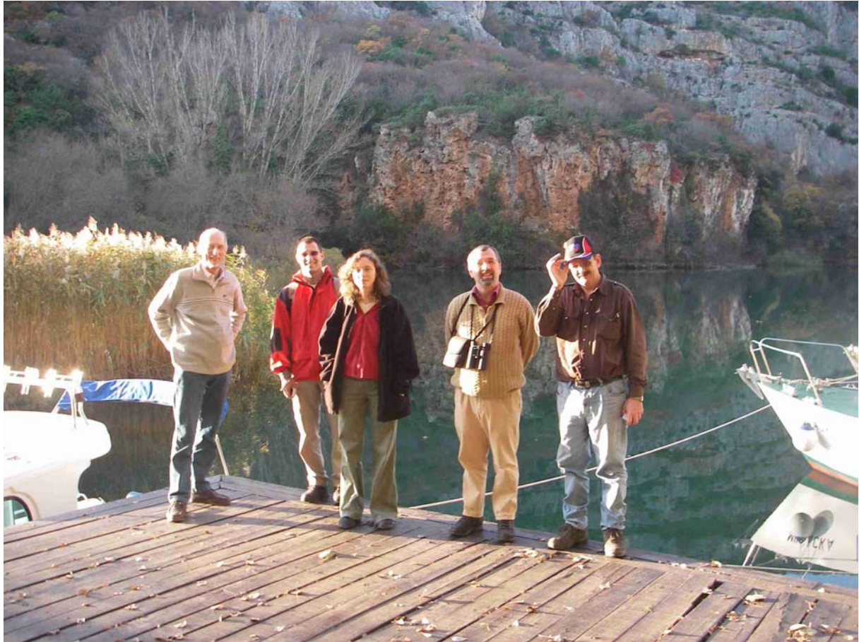
EINIGE UNSERER KOLLEGEN AUS HOLLAND UND AUSTRALIEN