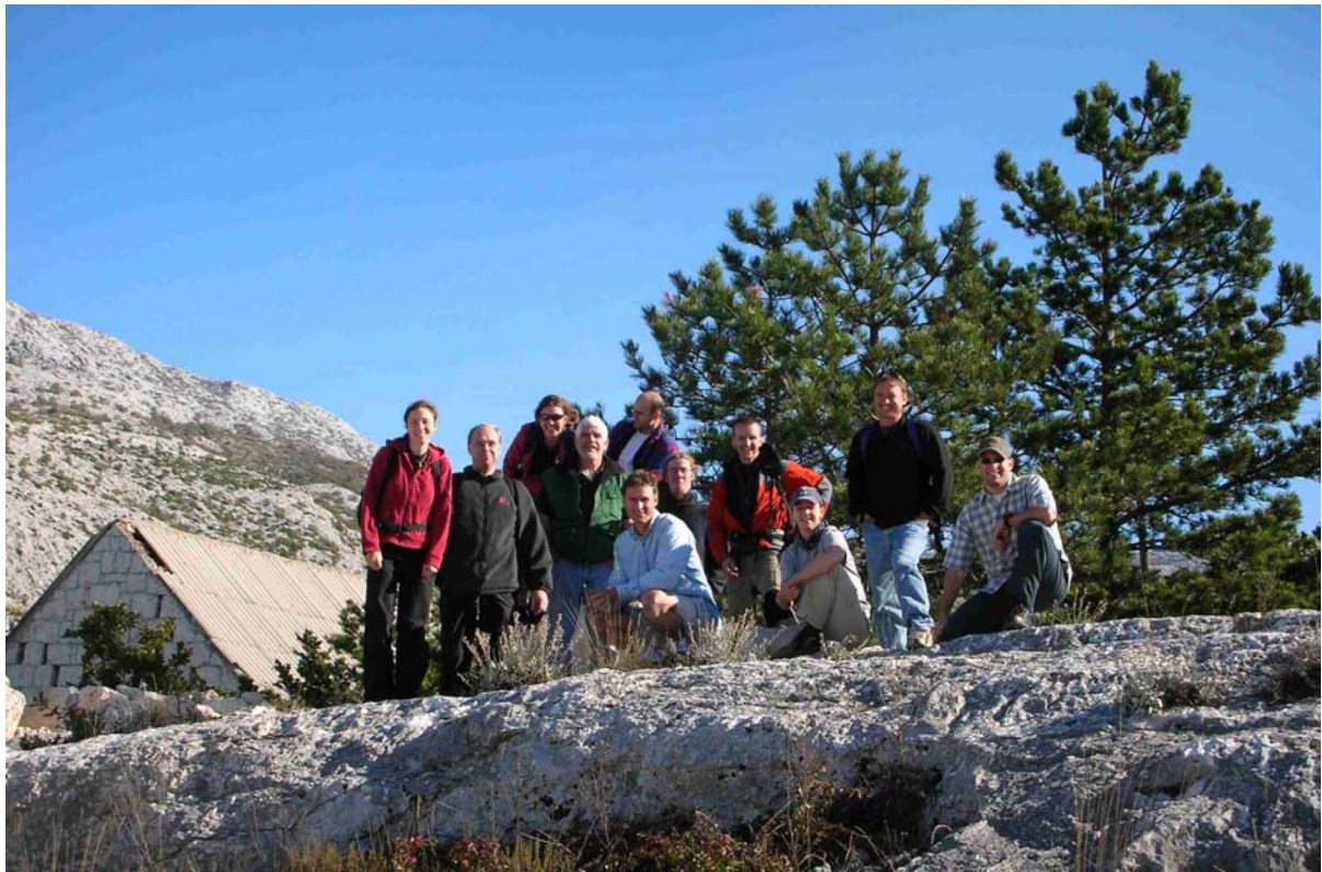
DAS TEAM AM AUSGANGSPUNKT UNSERER WANDERUNG