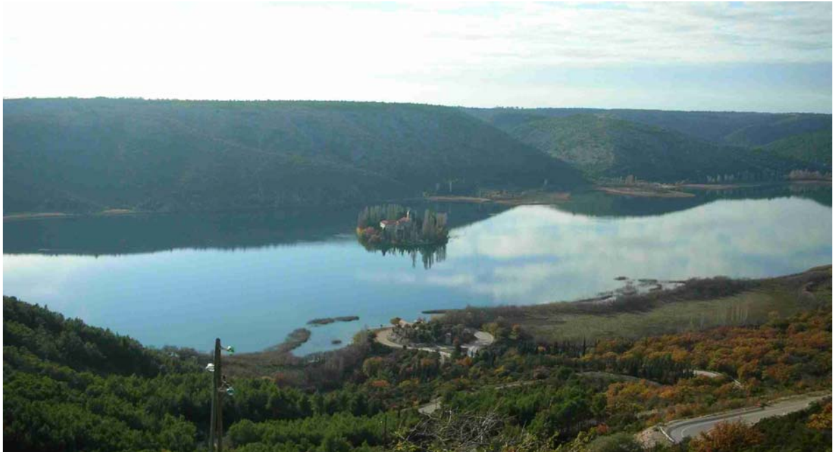
DAS FRANZISKANER-KLOSTER „VISOVAC“ MITTEN IM SEE