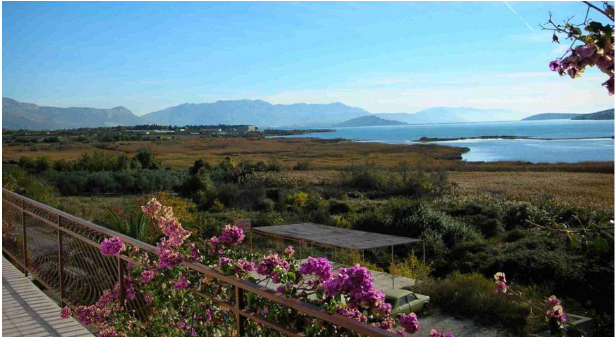
DER BLICK VON UNSEREM BALKON AUF UNSER 1. AUSFLUGSZIEL: DIE BERGE HINTER SPLIT